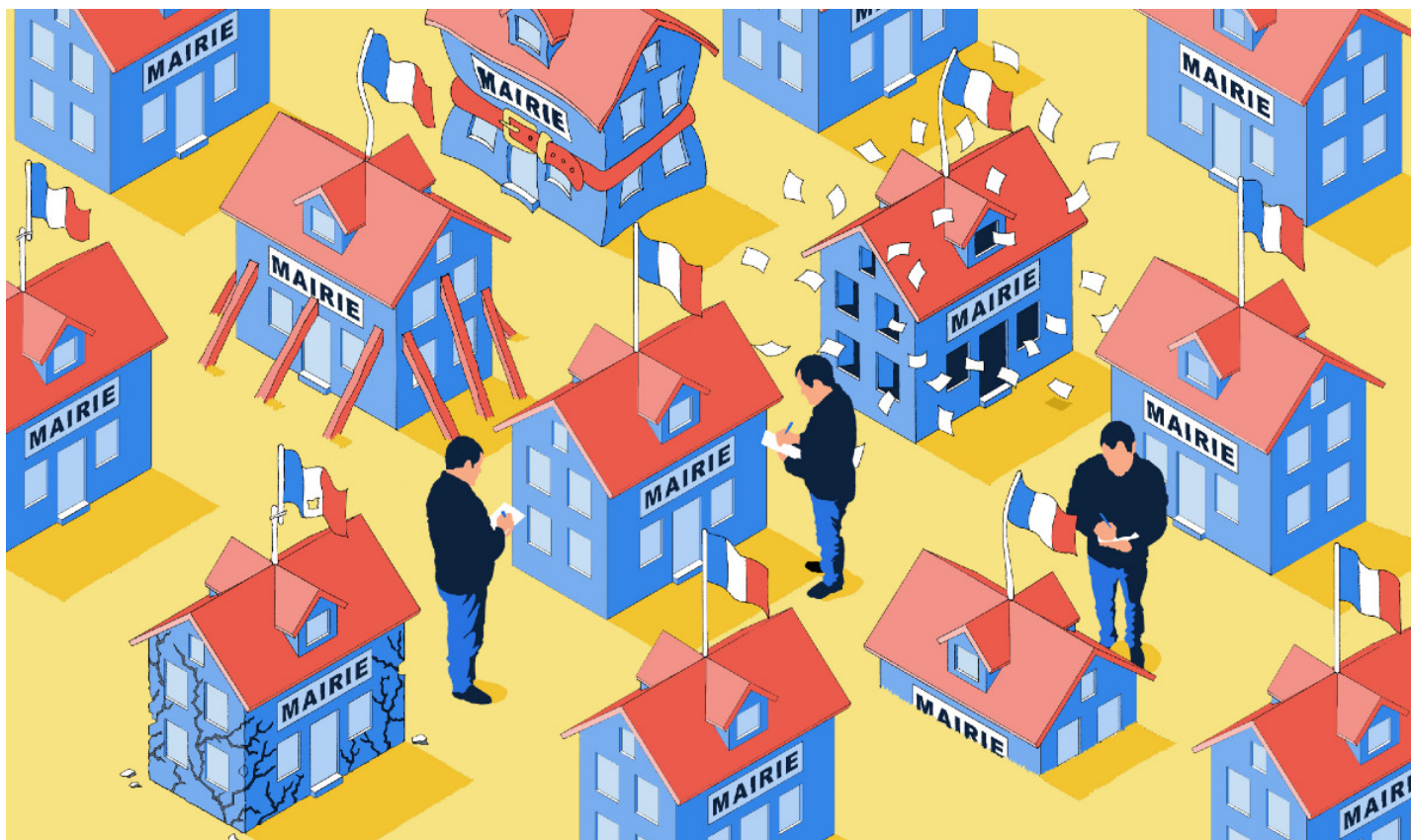
Illustration Jean-Paul Van der Elst

Pour la première fois, de nombreuses listes municipales se sont présentées sous la bannière citoyenne dans la métropole lilloise, avec des succès variables. Mais, au fait, qu'est-ce qu'une liste citoyenne? En quoi diffère-t-elle des autres listes? Et que signifie cette éclosion? Au delà du scrutin municipal, les listes citoyennes peuvent-elles modifier profondément la manière dont on pratique la politique? Tentative de réponse en vidéo avec :